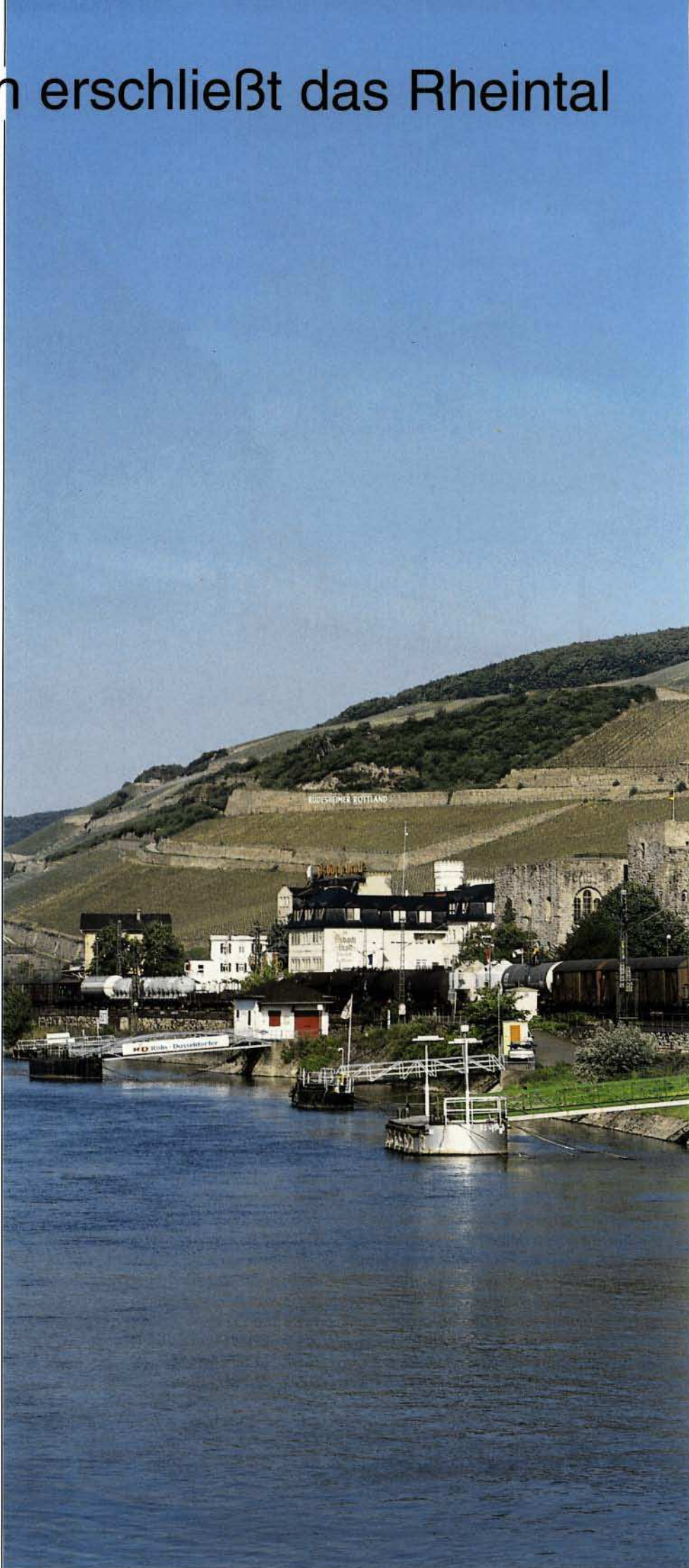
Bild 5: In Rudesheim verläuft die Bahntrasse durch den bekannten Weinort unmittelbar am Rheinufer entlang, wo am Morgen des 19. Mai 1992 die 140 117 die Szene belebte. Ein beliebtes Ausflugsziel ist das auf der Anhöhe gelegene Niederwalddenkmal mit unvergleichlichem Ausblick auf das Rheintal.

Von der rechtsrheinischen Stadt Deutz aus (bis 1888 war Deutz eine selbständige Gemeinde) nahm am 20. Dezember 1845 die Cöln-Mindener Eisenbahngesellschaft den regulären Eisenbahnbetrieb nach Düsseldorf auf. Dieselbe Gesellschaft realisierte bis Mai 1847 die Weiterführung quer durch das Ruhrgebiet nach Hamm, von wo aus es wenig später weiter nach Minden ging. Am 22. August 1853 bekam die Cöln-Crefelder Eisenbahn-Gesellschaft die Konzession zum Bau der 53,7 km langen Linie von Köln nach Krefeld. Eröffnet wurde diese in zwei Etappen: am 15. November 1855 Köln – Neuss und am 26. Januar 1856 Neuss – Krefeld.