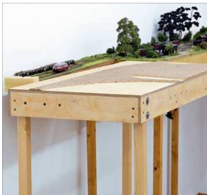
Dock an mich an! Berthold Wittich hat seine eigenen Module entwickelt für eine ausge dehnte Schmalspur-Anlage. Seite 78.