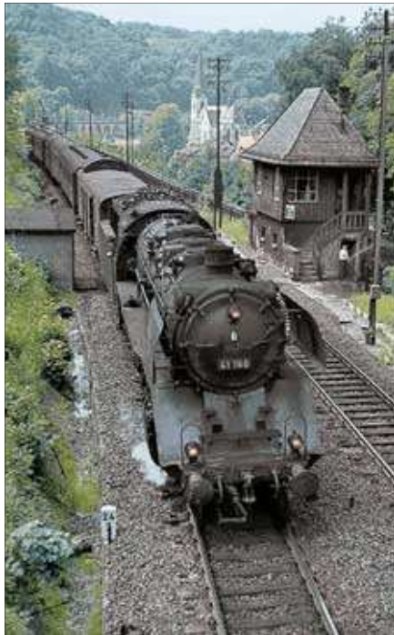
Eins, zwei, drei, vier – Eppstein! Alles muss versteckt sein! Ein Anlagenvorschlag mit mobilen Segmenten von Michael Meinhold und Thomas Siepmann rund um das Vorbild Eppstein im Taunus. Seite 24.