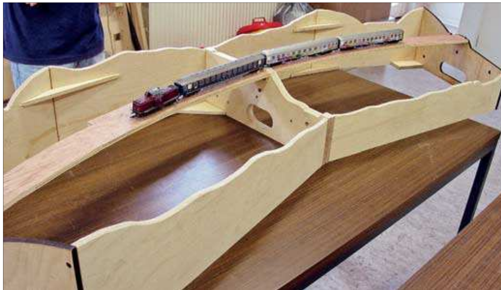
Haltepunkt Breithardt Horst Meier referiert über Grundlagen der Modultechnik – Bau, Einsatzmöglichkeiten und Betrieb. Seite 48.