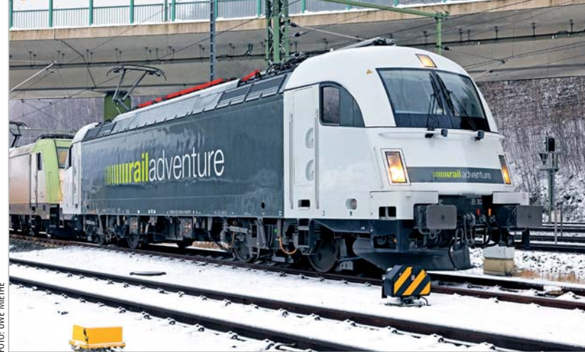
Lok 183 500 von Railadventure wartet bei ihrem ersten Einsatz am 11. Januar 2019 in Bad Schandau auf ihren Zug aus Tschechien.

klassische Schaltwerkslokomotive war für den gewünschten Einsatzbereich nicht verfügbar. Die bisher nur mit PZB/LZB ausgerüstete 183 500 wird nun mit Länderpaketen für Polen, Tschechien, Ungarn und Rumänien versehen. Die Umbauten sollen im Frühjahr 2019 realisiert werden. Bis dahin kommt die Lokomotive primär im Rahmen von Versuchsfahrten mit den Mireo-Zügen von Siemens und den Flytoget-Einheiten von CAF auf dem deutschen Schienennetz zum Einsatz. Dazu wurde die Lok im Januar