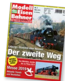
Titel: 35 1113 mit Güterzug am 31.12.1982 bei Gleisberg-Marbach + 44 von Märklin

Früher von einiger Bedeutung, war die Strecke Leipzig – Döbeln – Dresden in den letzten Jahren vom Niedergang gekennzeichnet. Dabei wäre sie eine sinnvolle Verkehrsalternative.