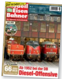
Titel: V80 von Trix, V200 von Roco, V160 von Brawa in H0