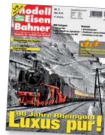
Titel: Rheingold-Zugset von Märklin in H0