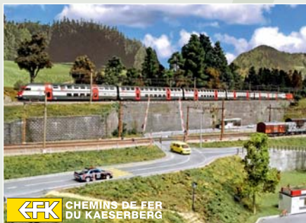
CFK CHEMINS DE FER DU KAESERBERG