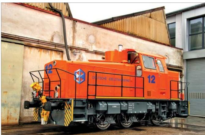
Das Foto vom 16. März zeigt die im frischen Glanz erstrahlende D12 im Werksgelände der Gmeinder Lokomotiven GmbH in Mosbach/Baden.