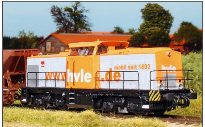
54 In Stendal wurden zahlreiche Loks der DR-Baureihe V 100 modernisiert und kamen danach bei vielen Privatbahnen zum Einsatz. Mit dem im 3D-Verfahren gedruckten Bausatz von Shapeways baute Sebastian Koch ein Roco-Modell um, als Vorbild diente ihm dabei eine bei der Havelländischen Eisenbahn eingesetzte Maschine.