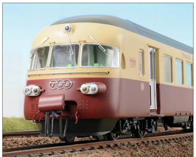
66 Mondäne Züge stehen bei vielen Modellbahnern hoch im Kurs – L.S.Models hat jetzt die Flotte der TEE-Triebzüge um den Schweizer RAe in der Baugröße H0 ergänzt. Gerhard Peter hat das Modell ausführlich getestet.