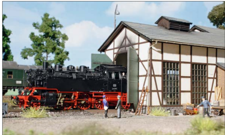
42 Das Bahnhofsensemble „Tannau“ ergänzte Noch jetzt mit dem Modell eines Lokschuppens. Bruno Kaiser hat den Lasercut-Bausatz für seine Anlage gebaut und hält für die Verarbeitung und Gestaltung einige Basteltipps bereit.